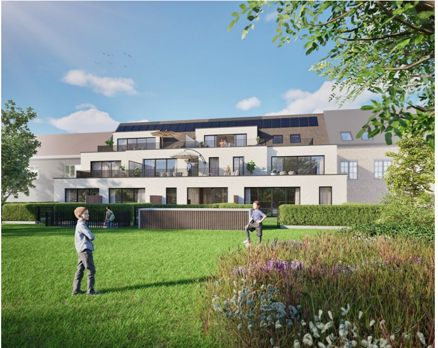
De Groene Brug